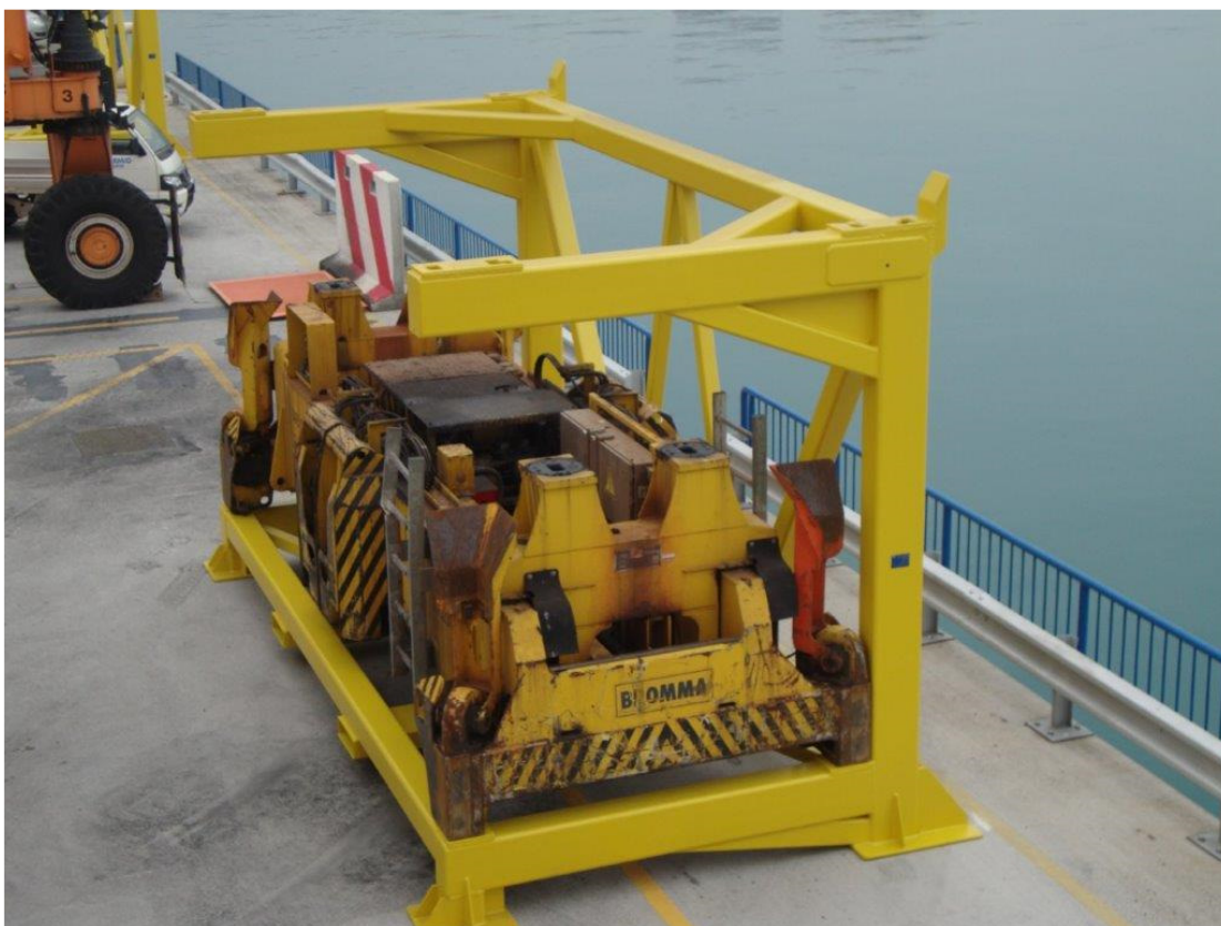
Slika 1: primer obstoječega podstavka za 2 kosa kontejnerskih prijemal-sprederjev

Na sliki 1 primer obstoječega podstavka za dva kontejnerska spreaderja. Na sliki zgornji spreader ni nameščen.