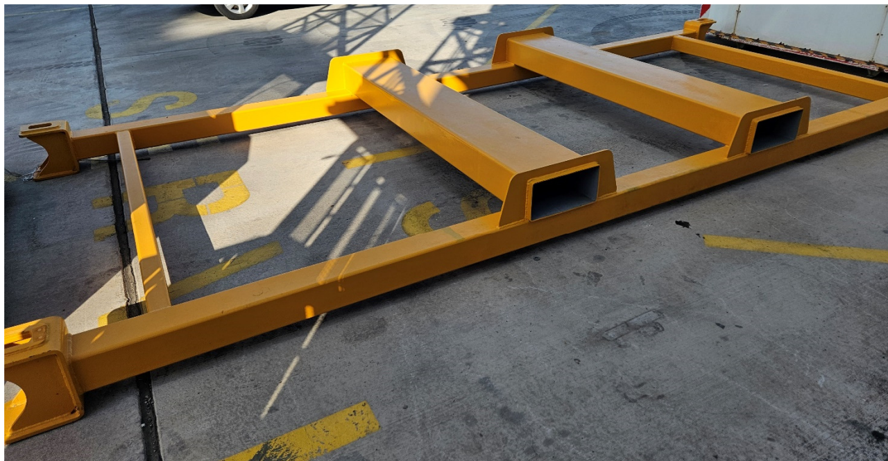
Slika 4 – podstavek za OH prijemala

Podstavek za OH prijemala že obstaja in se uporablja na območju pristanišča – kontejnerskega terminala (glej sliko 4). Zahteva končnega uporabnika je izdelava treh (3) novih enakih podstavkov z ustreznimi dokazili in izjavami o skladnosti/izjavami o lastnostih. Kontejnerski terminal uporablja različne tipe OH prijemal, njihova lastna teža je od 3400kg – 3700 kg (glej tehnološki list).