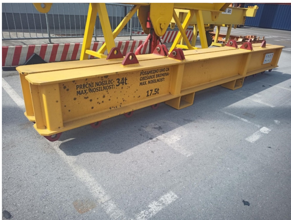
Slika 3.3 - Nosilec, prečni, nosilnosti 2 x 340 kN (rumena barva)