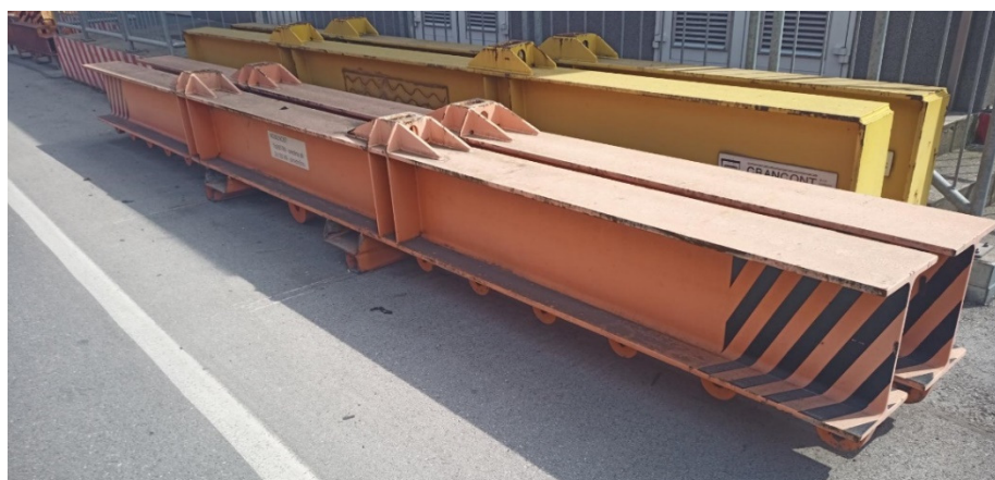
Slika 3.1 - Nosilec, prečni, nosilnosti 2 x 130 kN (oranžne barve), ter nosilec, prečni, nosilnosti 2 x 110 kn (rumene barve)