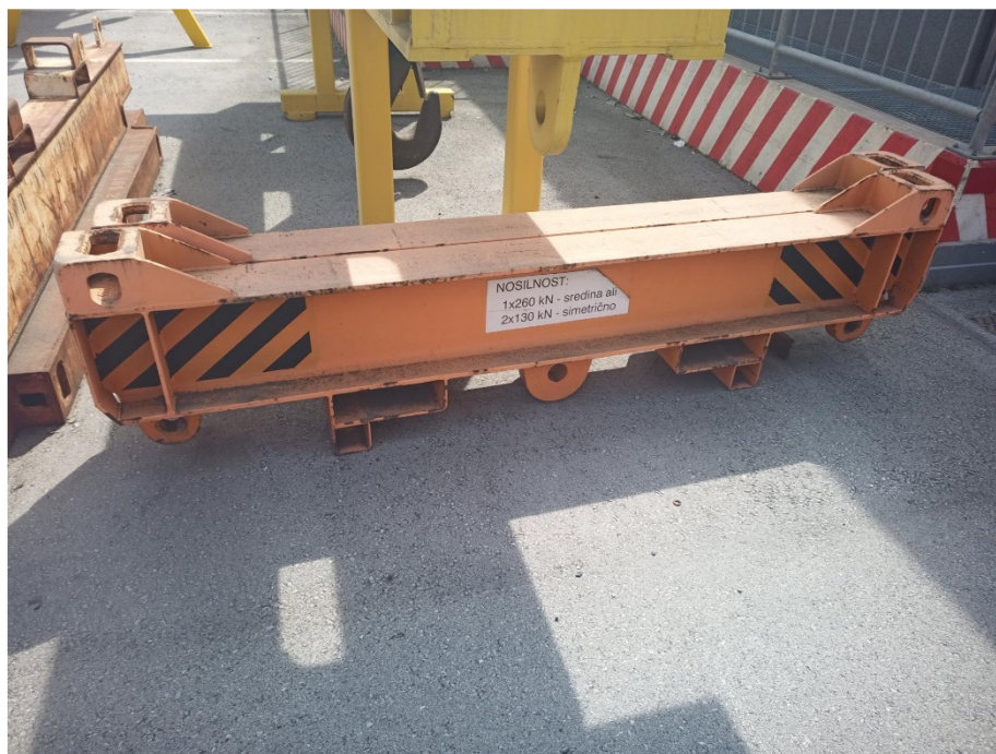
Slika 3.2 - Nosilec, prečni, nosilnosti 2 x 130 kN oz. 1 x 260 kN (oranžne barve)