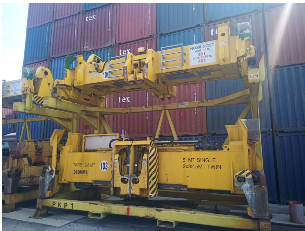
Slika 2: primer obstoječega podstavka z naloženima dvema spreaderjema

Spreaderji se na podstavke odlagajo s pomočjo viličarja ustrezne nosilnosti. Za to manipulacijo sta predvidena viličarja 8 in 33 ton nosilnosti. V ta namen morajo biti na podstavku nameščeni žepi ustreznih dimenzij (glej tehnična lista viličarjev in preveriti dimenzije).